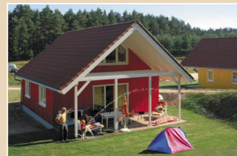
Komfortable Ferienhäuser für 2 – 6 Personen.