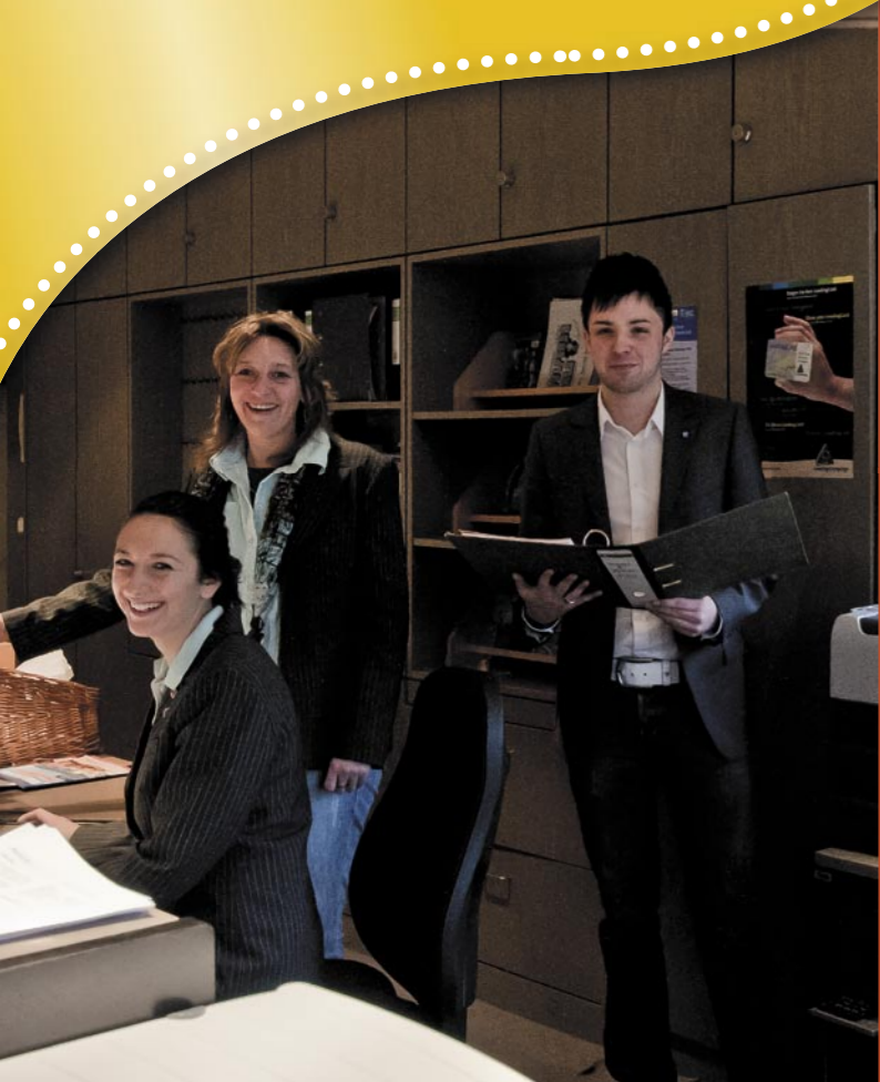
Wir sind gerne für Sie da.