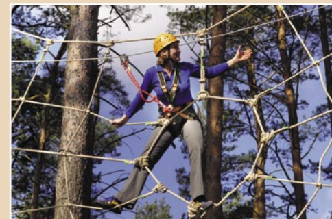
Wald-Hochseilgarten für alle Altersgruppen ab 12 Jahren.